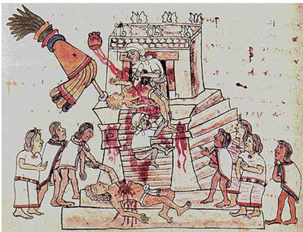
El corazón y su representación sagrada

Es de imaginar que el carácter vital del corazón, así como su posición anatómicamente central, hayan forjado en el hombre la asociación mental de lo cardíaco con lo central como ha quedado plasmado en la lengua española a través de términos como core y corona , provenientes de la raíz latina cor , y a su vez esta de la indoeuropea ker , la cual designa “lo esencial para la vida”. Resulta, entonces, que por esta misma razón la raíz ker es también la fuen-