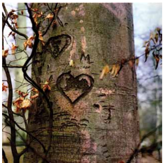
El corazón y su representación afectiva