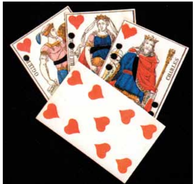
El corazón y su representación lúdica