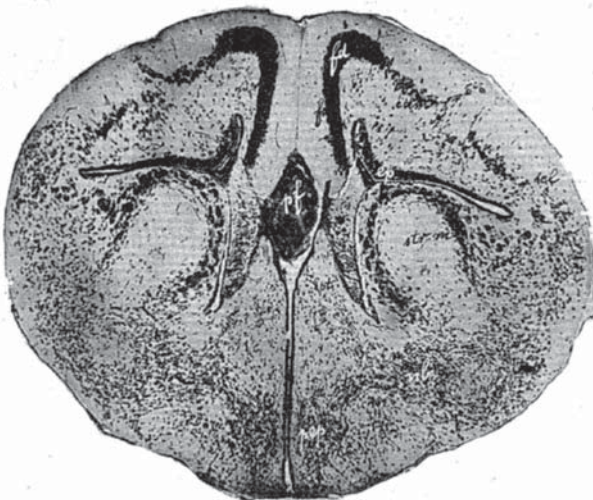
Figura 1. "Folia" Atlas III Lámina XXVIIIa. Fd: fascia dentada, Strm: cuerpo estriado.

La Figura 2 muestra un corte frontal de cerebro de feto de tres meses y medio al nivel del rombencéfalo. Por el proceso de segmentación aparecen sucesivamente zonas corticales parasagitales constituyendo las circunvoluciones primordiales (en orden filético: segmentos amoníco, esplénico, ectomarginal, suprasilviano y ectosilviano ). La sectorización , en cambio, opera en sentido transverso, resultando en la aparición de los sectores frontales, centrales, parietales, occipitales y temporales.