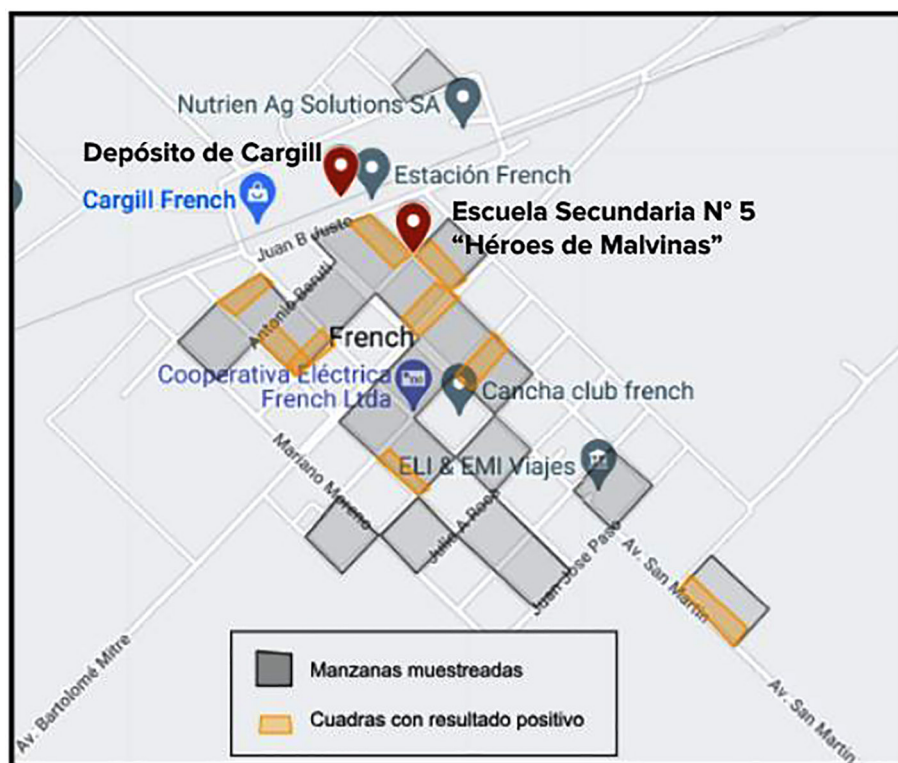
Figura 4. Georreferenciación de las manzanas muestreadas y cuadras con personas con muestras positivas para glifosato. Calles con circulación de camiones mosquitos, localización de silos y depósitos de cereales de la localidad de French, Municipalidad de 9 de julio, Pcia. de Buenos Aires, Argentina

Si bien existen laboratorios de alta complejidad que realizan medición de plaguicidas, los circuitos de derivación para intoxicaciones agudas y/o monitorización de la exposición, sea ambiental o laboral, no están protocolizados por el sistema de salud. Para iniciar el circuito proponemos informatizar sistemas de vigilancia comunitarios (como la notificación mediante apps,