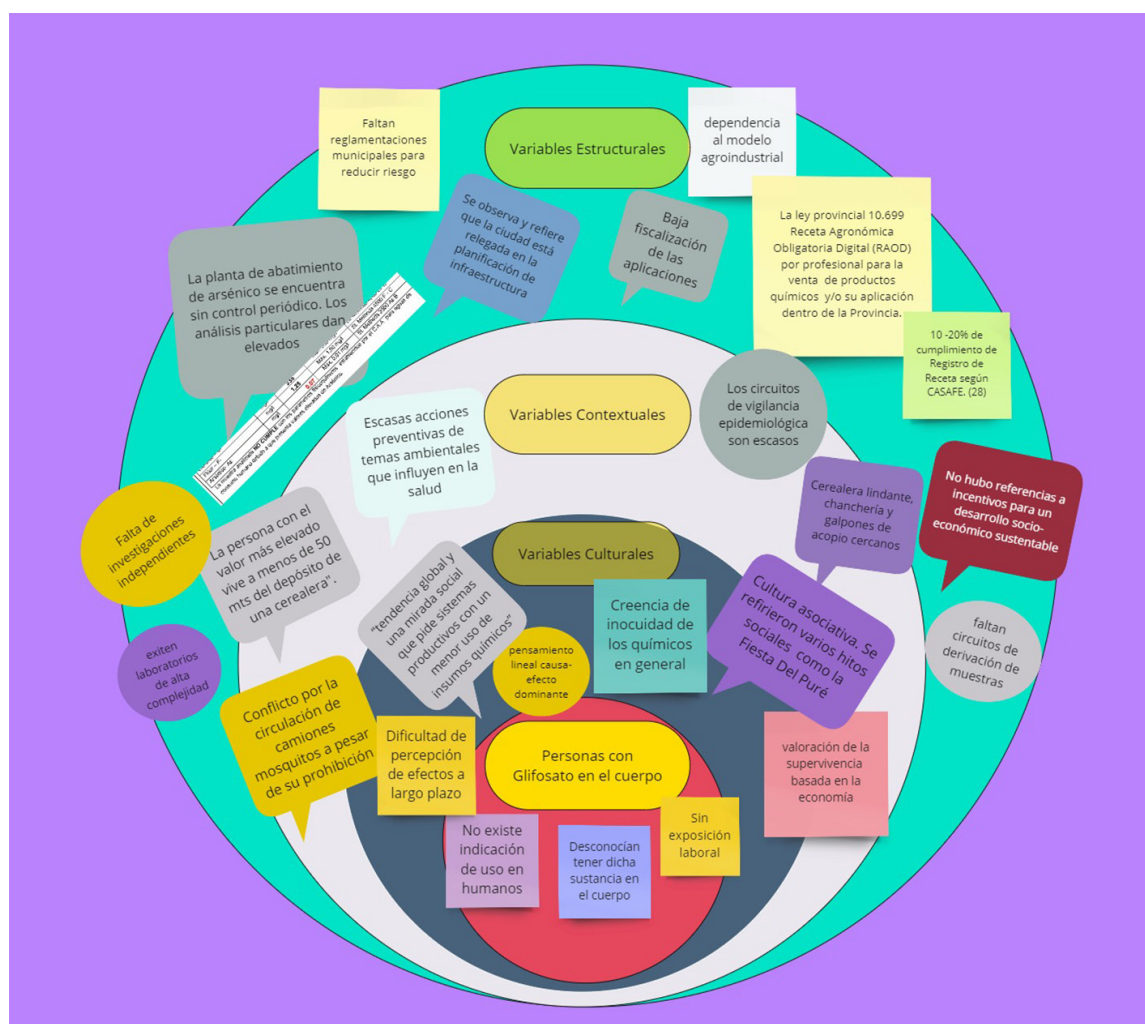
Figura 3. Modelo sistémico de condicionantes estructurales, contextuales y culturales que influyen directa o indirectamente en la contaminación ambiental de las personas que viven en French.

D. La regulación insuficiente del modelo productivo se ve reflejada en las leyes vigentes por su falta de implementación efectiva. Un ejemplo de esto es la Ley 10669 a nivel provincial, que prohíbe la aplicación de productos sin una receta agronómica obligatoria. Según la Cámara de Sanidad Agropecuaria y Fertilizantes (CASAFE), esta disposición se cumple en un 20% 28 .